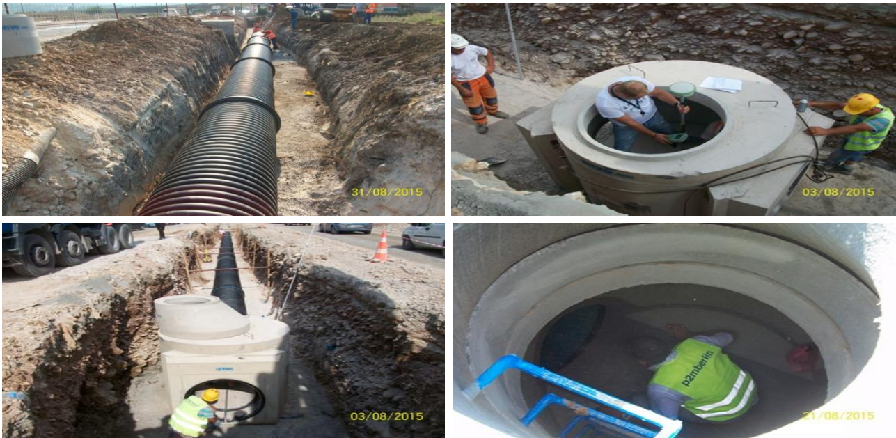
Fig 1. Punet ndertimore Task A, P117 to P12

Instalimi i pusetave nga P101 deri P151 gjithsej 150 puseta, si dhe te gjitha pjeset percjellese.