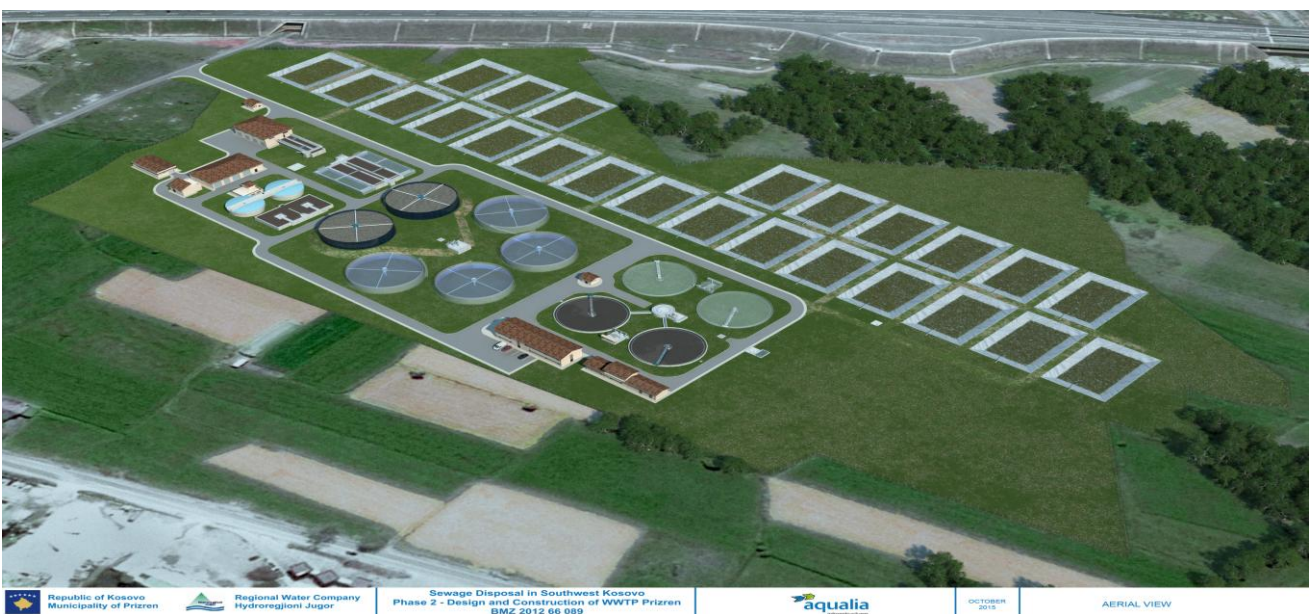
Pamja e ITUZ-se ne 3D

-Punëdhënësi HRJ ka shprehur gadishmërinë për t'i asistuar Kontraktorit në të gjitha çështjet për të marrë lejet e kërkuara. Ligjet relevante dhe udhëzimet administrative iu janë dhënë Kontraktorit.