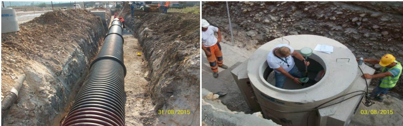
Fig 1. Punet ndertimore Task A, P117 to P12

- Kane perfunduar punimet ne ndertim te pusetes shkarkuese (kaperderdhesit) CSO S1 tek rrethi i fshati Hoqe e Qytetit, ku ky kaperderdhes eshte ndertuar brenda trupit te rruges M25 dhe njeherit bene lidhjen e kolektorit ekzistues me ate te kolektorit te ri.