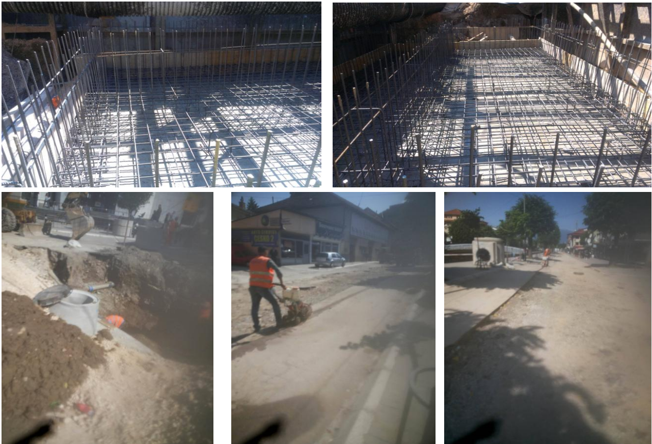
Fig 3. Punet ndertimore Task B, Rr Remzi Ademaj-Nga Hotel Theranda deri te Komuna

Kane perfunduar punimet ne ndertim te pusetes shkarkuese (kaperderdhesit) CSO S1 tek rrethi i fshati Hoqe e Qytetit, ku ky kaperderdhes eshte ndertuar brenda trupit te rruges M25 dhe njeherit bene lidhjen e kolektorit ekzistues me ate te kolektorit te ri.