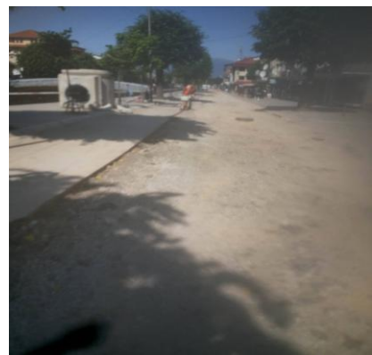
Fig 2. Punet ndertimore Task A, CSO 1