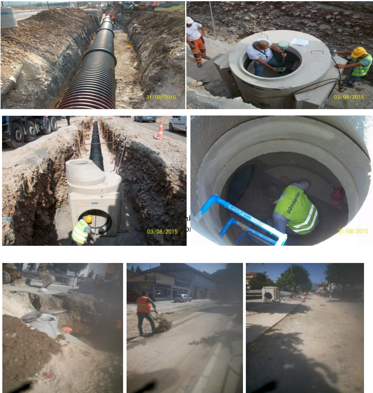
Fig 3. Punet ndertimore Task B, Rr Remzi Ademaj-Nga Hotel Theranda deri te Komuna