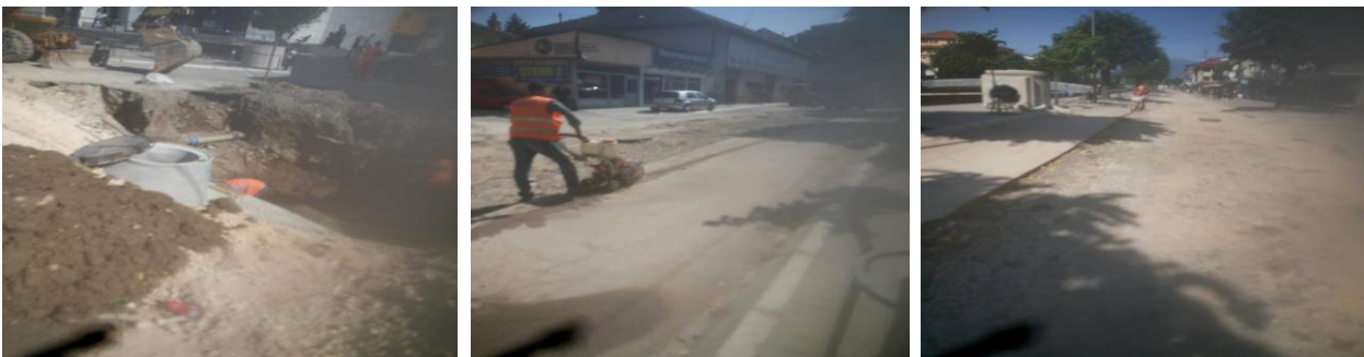
Fig 3. Punet ndertimore Task B, Rr Remzi Ademaj-Nga Hotel Theranda deri te Komuna