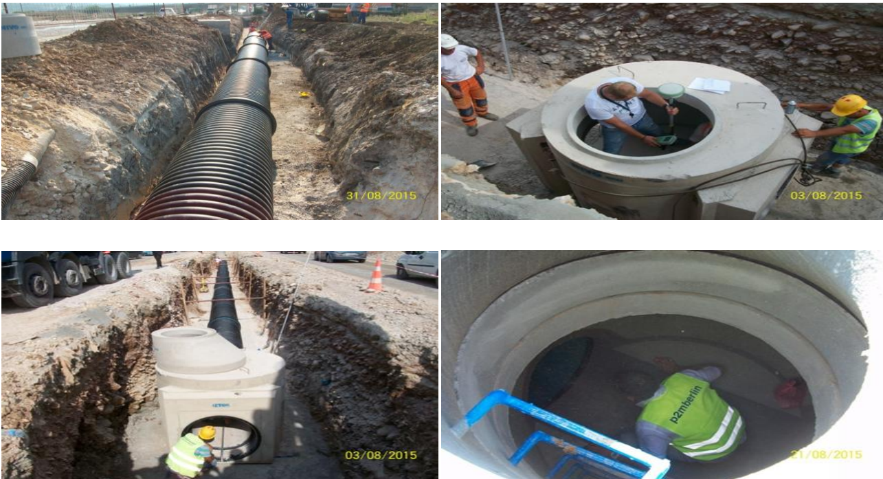
Fig 1. Punet ndertimore Task A, P117 to P12

- Kane perfunduar punimet ne ndertim te pusetes shkarkuese (kaperderdhesit) CSO S1 tek rrethi i fshati Hoqe e Qytetit, ku ky kaperderdhes eshte ndertuar brenda trupit te rruges M25 dhe njeherit bene lidhjen e kolektorit ekzistues me ate te kolektorit te ri.